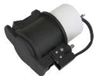
ID-300 Suguttag med rörmuff